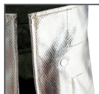
Isolierter Federstahlkorb im Schaft