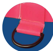
Anneau "D" en plastique