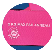
Sérigraphie du poids maximum par anneau