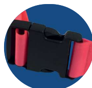
Attache sécurisée en plastique