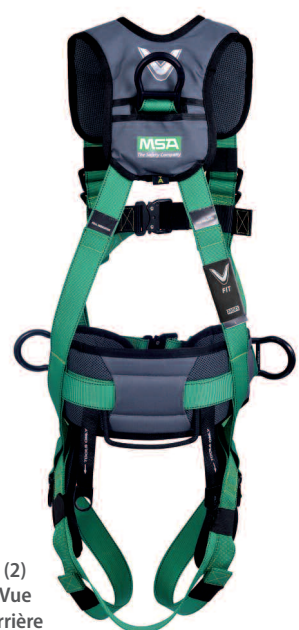
(2) Vue arrière