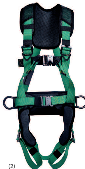
(2) Vue avant