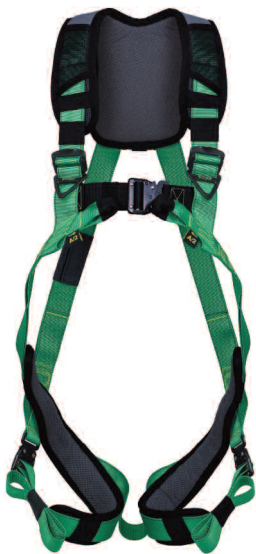
(1) Vue avant