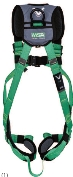
(1) Vue arrière