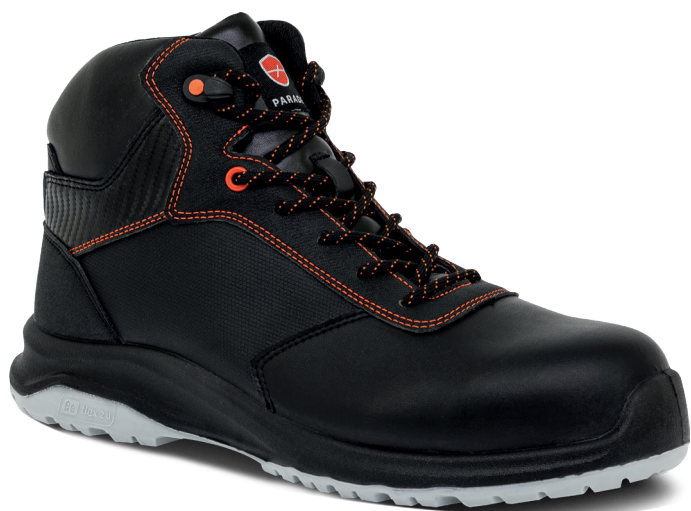
■ 9834 NOIR | 35 ▶ 48