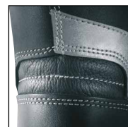
Système de maintien de la cheville HAIX® AF