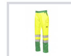
JAUNE FLUO/VERT GELÉE