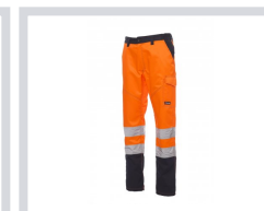
ORANGE FLUO/BLEU MARINE