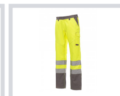
JAUNE FLUO/GRIS ACIER