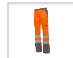
ORANGE FLUO/GRIS ACIER