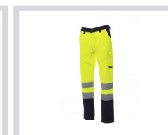
JAUNE FLUO/BLEU MARINE