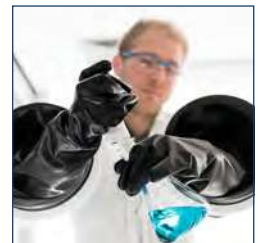
GANTS POUR BOÎTES À GANTS ET ISOLATEURS