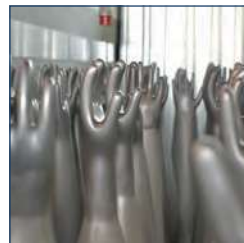
GANTS DE PROTECTION