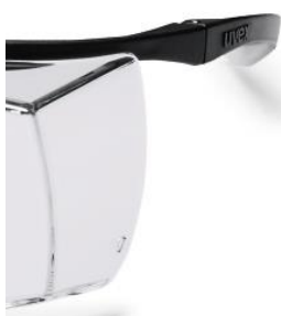
Branches flexibles avec charnières