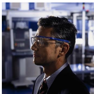
Positionnement des branches