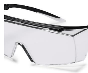
Large écran panoramique